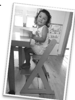
足の裏がつく椅子の一例

A 高さの合った椅子でないと姿勢が崩れ、上手に噛むことができません。足の裏が床にしっかり付く椅子に座ると良いでしょう。食材は大きめに切っています。（花見光）