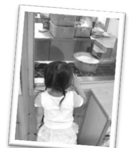
作る様子が見える給食室（花鶴どろんこ）

料理を手伝ったり、野菜を育てることで、食への興味がわくようです。面倒なこともあります。家庭でも工夫してみませんか。幼児期は長いようで短いです。根気強く付き合っていきましょう！